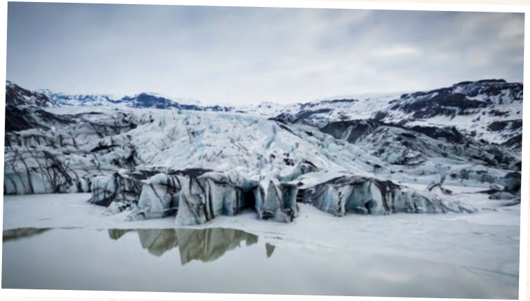
SÓLHEIMAJÖKULL LAGUNE

Zum Abschluss des Tages besuchen Sie mit dem Seljalandsfoss , einen weiteren imposanten Wasserfall. Der Sprühnebel der 60 Meter hohen Wasserwand gefriert im Winter teilweise zu feinen Eiskristallen oder gar Eiszapfen, die eine besonders winterliche Atmosphäre schaffen. (Dauer insgesamt ca. 12 Stunden).