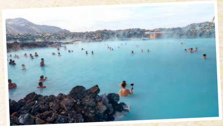
BLAUE LAGUNE

Die Kombination aus Naturerlebnis und hochwertigem Wellness-Ambiente macht diesen Ausflug zu einem idealen Gegenpol zu den aktiveren Programmpunkten Ihrer Reise.