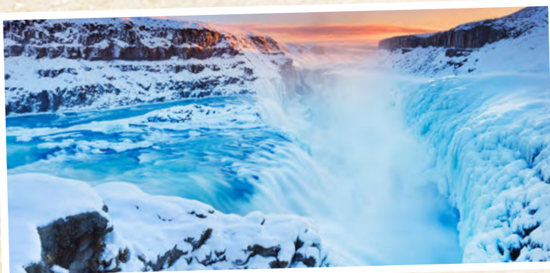
GULLFOSS WASSERFALL