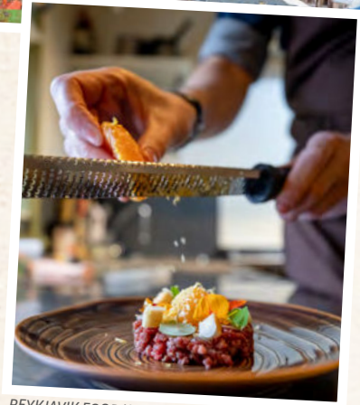
REYKJAVIK FOOD WALK

Heute haben Sie zunächst Zeit für eigene Erkundungen in Reykjavík . Beginnen Sie den Tag zum Beispiel mit einem gemütlichen Spaziergang entlang der malerischen Uferpromenade von Reykjavík mit Blick auf die schneebedeckten Berge und das glitzernde Meer. Besuchen Sie die ikonische Hallgrímskirkja mit ihrer beeindruckenden Architektur und fahren Sie mit dem Aufzug hinauf zur Aussichtsplattform, die Ihnen einen atemberaubenden Panoramablick über die Stadt gewährt. Sie können auch einfach durch die bunten Gassen des Stadtteils Grandi schlendern und kleine Boutiquen, Kunstgalerien und gemütliche Cafés entdecken. Ein Besuch im Nationalmuseum von Island bietet Ihnen spannende Einblicke in die Geschichte und Kultur des Landes.