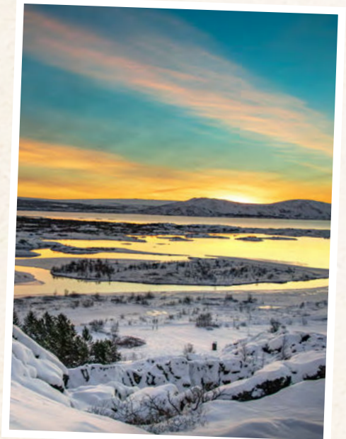
PINGVELLIR NATIONALPARK

Ihre heutige Route führt Sie zu einigen der eindrucksvollsten Naturhighlights der Insel. Erster Stopp ist der Pingvellir Nationalpark . Pingvellir ist nicht nur ein geologisches Wunder, sondern auch ein historisch bedeutsamer Ort, an dem das isländische Parlament, das Alþing, im Jahr 930 gegründet wurde. Der Nationalpark ist geprägt von vielen beeindruckenden Spalten und Rissen, die durch die Bewegung der nordamerikanischen und eurasischen tektonischen Platten entstanden sind. Hier findet man auch den größten natürlichen See Islands, den Þingvallavatn. Anschließend geht es weiter zum berühmten Geysir Strokkur . Hier spüren Sie sofort die Energie des Landes: alle paar Minuten schießt die heiße Wassersäule in die Höhe und sorgt für einen Moment, der jedes Mal aufs Neue überrascht. Dieses Naturphänomen ist nicht nur ein Fotomotiv, sondern spiegelt auch perfekt die Dynamik Islands wider. Nur wenige Minuten entfernt erwartet Sie der Gullfoss – einer der eindrucksvollsten Wasserfälle des Landes. Die gewaltigen Wassermassen, die in zwei Stufen in die Tiefe stürzen, erzeugen ein beeindruckendes Naturschauspiel. Zum entspannten Abschluss des Tages genießen Sie die Laugarás Lagoon . Das warme, mineralreiche Wasser bietet den idealen Ausgleich nach einem Tag voller Eindrücke. (Dauer insgesamt: ca. 11 Stunden)