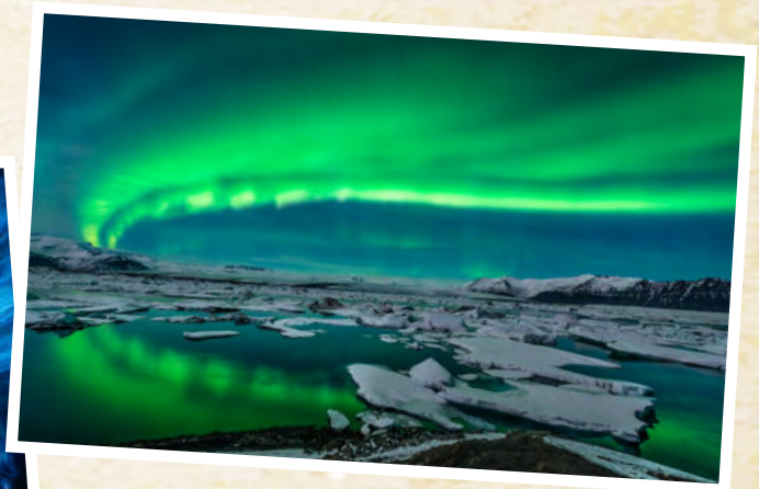
POLARLICHTER ÜBER ISLAND