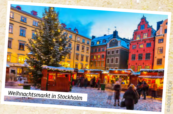
Weihnachtsmarkt in Stockholm