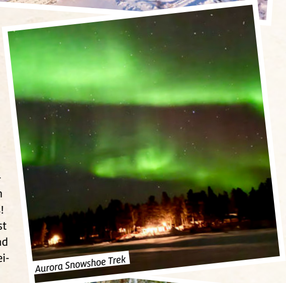
Aurora Snowshoe Trek