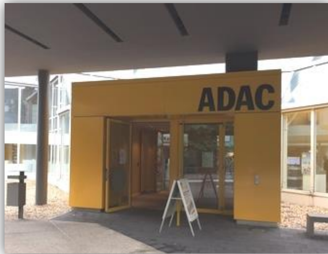
Eingang ADAC Nordrhein